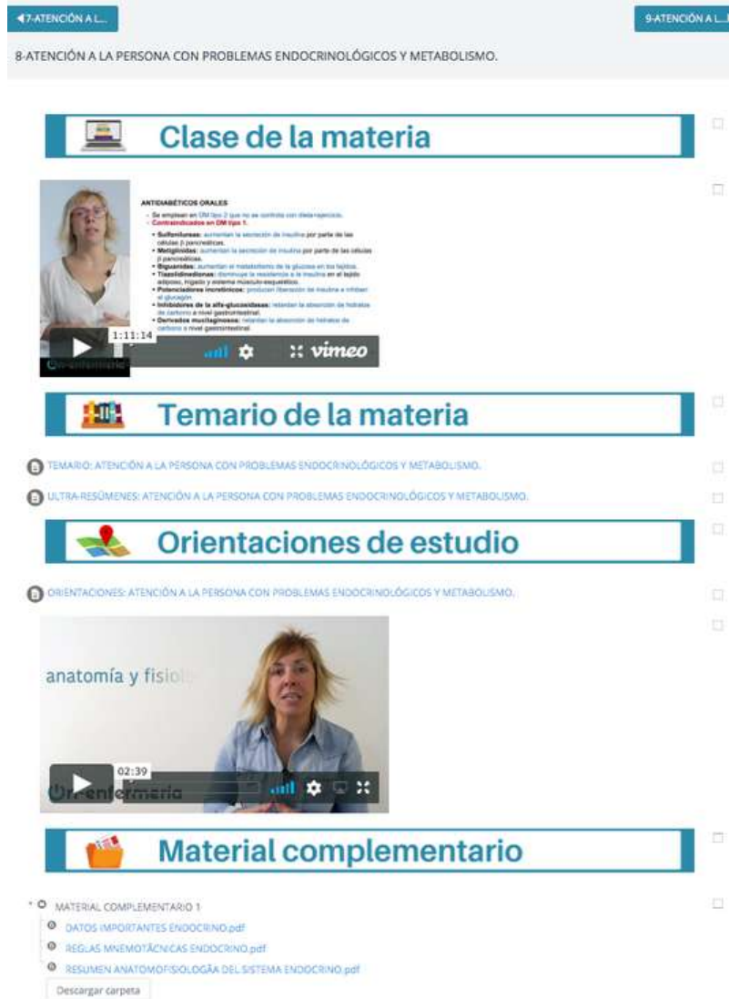
IMAGEN DEL CURSO